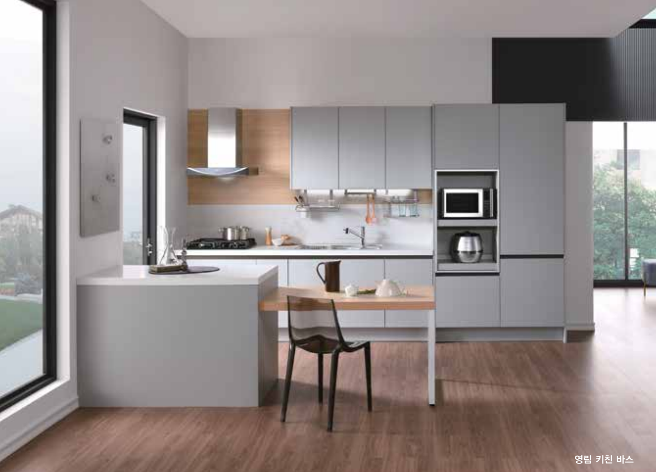
영림 키친 바스