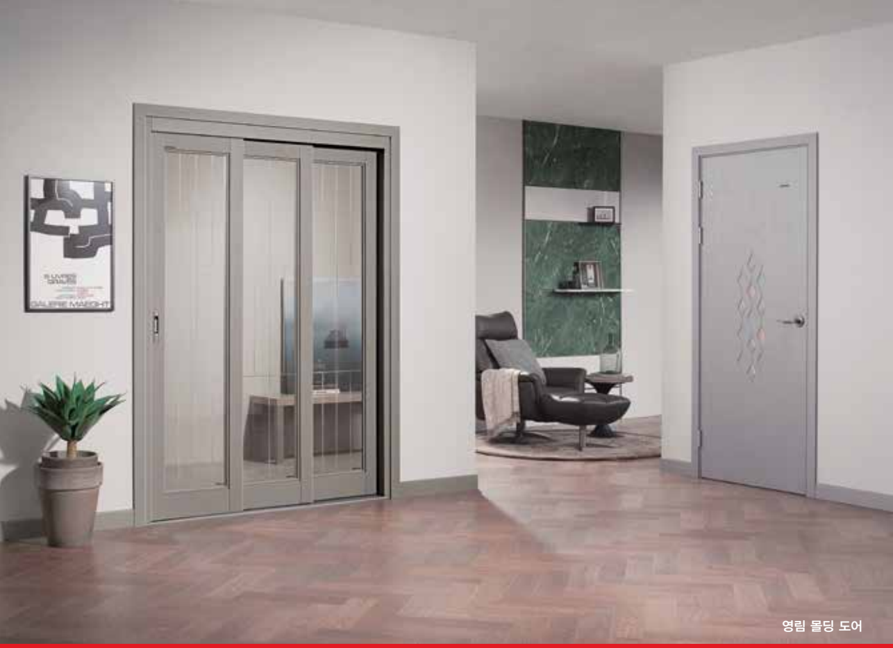
영림 몰딩 도어